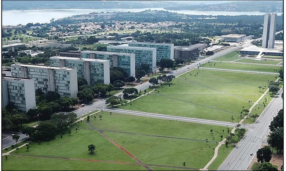
Tissu urbain de la ville de Brasilia