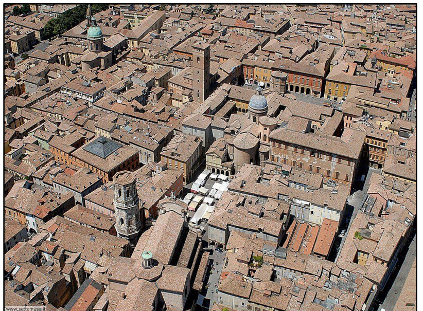
Tissu urbain de la ville de Parme